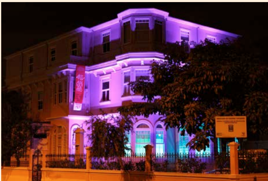
Edificio del Centro Costarricense de Producción cinematográfica, iluminado con motivo de la celebración del 40 Aniversario de la institución. Año 2013

categoría de Co-producción ($42.000); 4. “El baile y el salón”, largometraje de ficción de Iván Porras, en la categoría de Desarrollo ($10.000); 5. “Cuando cae la lluvia”, largometraje documental de Patricia Howell, en la categoría de Desarrollo ($10.000); y 6. “Monserrat”, largometraje de ficción de Nicolás Pacheco, en la categoría de Desarrollo ($5.000).