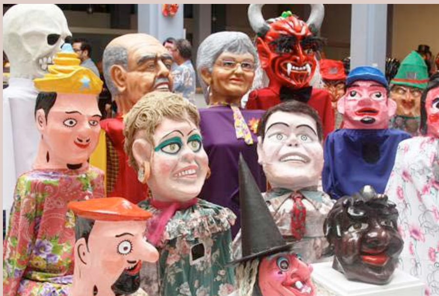
“Certamen de Nuestras Artesanías Tradicionales” del Centro de Investigación y Conservación del Patrimonio Cultural con el tema de la “Mascarada Tradicional Costarricense”. AÑO 2013.

Además, es importante señalar que se capacitó a