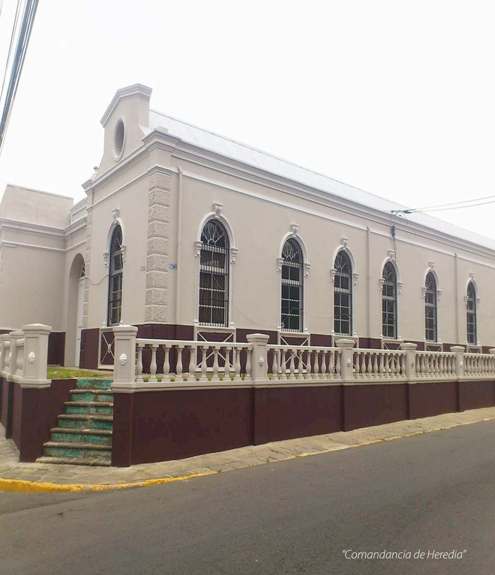
"Comandancia de Heredia"