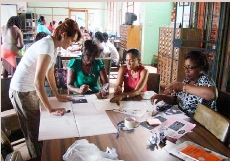
Docentes de primaria del cantón Limón en el Taller Ruta de los Héroes: "Métodos y técnicas didácticas para la enseñanza de la Campaña Nacional 1856-1857". Año 2013.

bajo el que se conoce fusilaron a Mora y Cañas; y 5. Conmemoración de la Fundación de la ciudad de Alajuela (231 años) con una serenata a la Virgen del Pilar (Patrona de la ciudad) desde los balcones del Museo; y la entrega de 2.000 ejemplares del libro "Orígenes de Alajuela" del Doctor Carlos Meléndez Chaverri. Actividades, que contaron con una asistencia estimada de 3.235 personas.