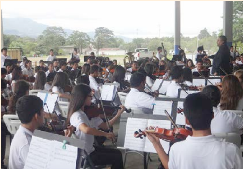
Orquesta Regional Juvenil del Tempisque en el 2º Festival de Orquestas Regionales. Año 2013

de danza del TPMS (SiNEM-Alvarado); Guanacaste: Concierto con Orquesta sinfónica en el Festival de la Nimbueras (SiNEM-Nicoya) y concierto con Orquesta sinfónica en el Festival Guanacastearte (SiNEM-Liberia); Puntarenas: Concierto con Orquesta sinfónica en el Hogar Comunidad Encuentro (SiNEM-Coto Brus) y taller de danza del TPMS (SiNEM-Cóbano); y Limón: Concierto con Orquesta sinfónica en Festival Ritmo y Sabor (SiNEM-Siquirres).