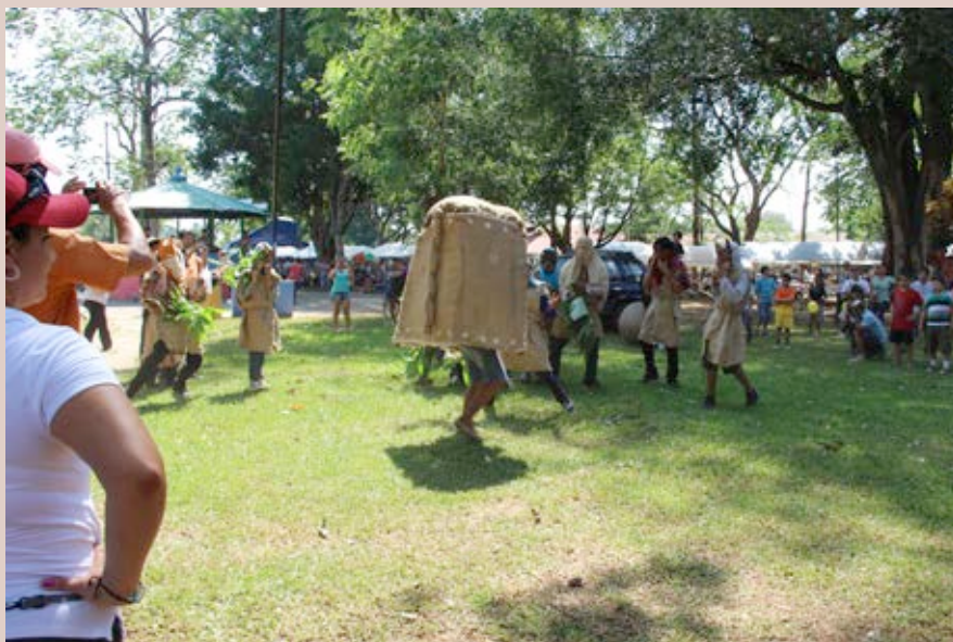
Parte de las actividades culturales realizadas en el marco de la IX edición del Festival de las Esferas 2013. Marzo de 2014.

Para el cumplimiento de las metas y competencias se invirtieron $2.561.327.319,90 que provienen de la transferencia del Gobierno Central.