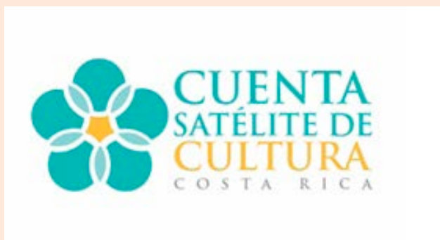
Logo de la Cuenta Satélite de Cultura de Costa Rica del Ministerio de Cultura y Juventud.

Con los resultados iniciales presentados en octubre del 2013, la CSCCR se convirtió en la primera Cuenta Satélite de Cultura de Centroamérica y el Caribe, la quinta de América Latina y la séptima del mundo. Las primeras mediciones incluyeron tres de los trece sectores del campo cultural: Editorial, Audiovisual y Publicidad. Actualmente, se miden Diseño y Educación Cultural y Artística. El período de años de estudio es 2010-2012 y la información se actualizará anualmente.