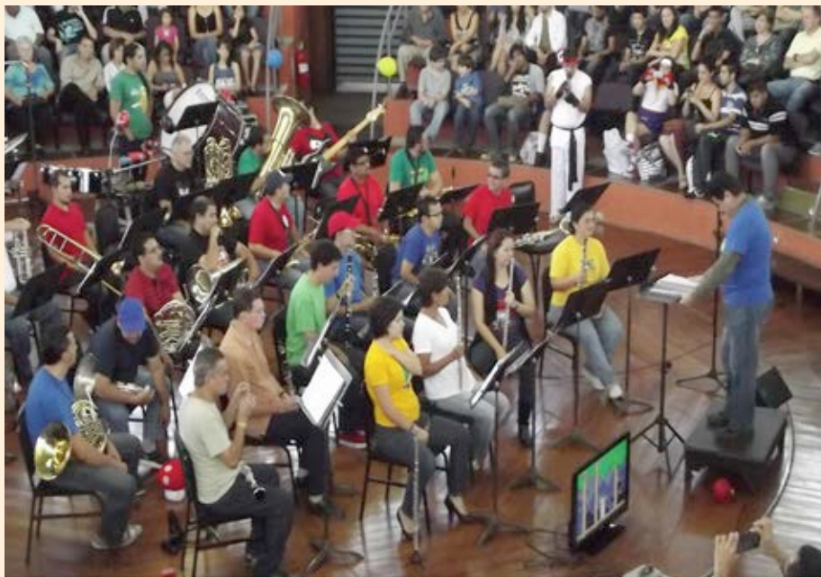
BANDA DE CONCIERTOS DE CARTAGO- TEMAS DE VIDEO JUEGOS

Con motivo del Mundial femenino de Fútbol en nuestro país, se realizó en marzo un concierto con todas las Bandas de Conciertos en Liberia (Guanacaste).