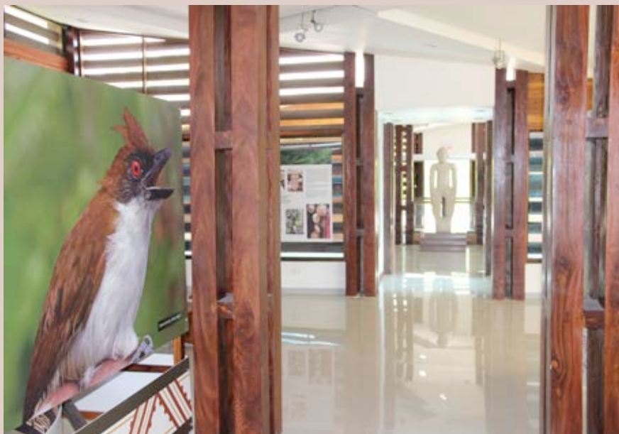
Exhibición alusiva a las culturas cacicales del Diquís en el Centro de Visitantes de Finca 6, en Osa (Puntarenas). Año 2013.

Cuatro visitas, en las cuales se impartió el Taller educativo: “Hagamos una vasija precolombina” el 4 de septiembre en la Escuela Fernando Guzmán en Agua Caliente (Cartago) con participación de 118 personas, el 14 de octubre en la comunidad de Pozos de Santa Rosa de Puriscal (San José) con participación de 25 adultos mayores del Grupo Ciudadanos de Oro Feliz; el 15 de octubre en Tejar del Guarco (Cartago) con participación de 16 adultos mayores; y 16 de octubre en el Hogar de Ancianos Santiago Crespo en la comunidad de El Brasil (Alajuela) con participación de 16 adultos mayores.