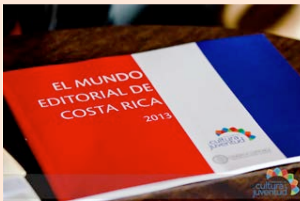
Primer catálogo del mundo editorial de Costa Rica. Año 2013.