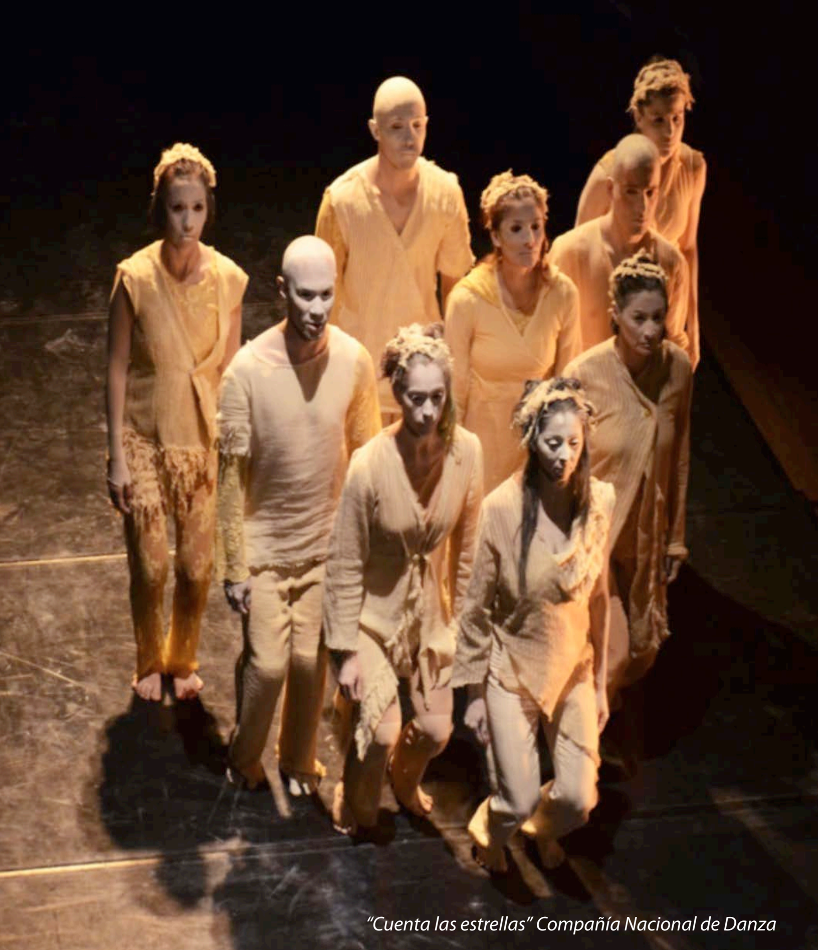
"Cuenta las estrellas" Compañía Nacional de Danza