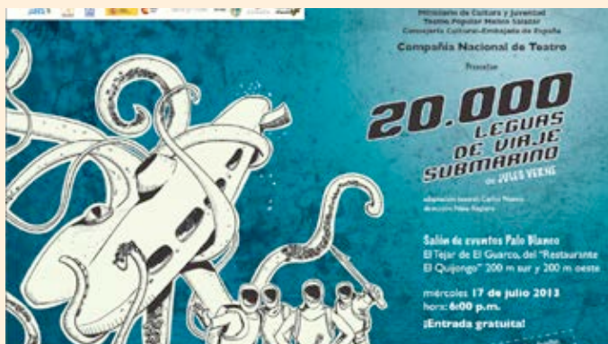
Afiche de la puesta en escena "20.000 Leguas de Viaje Submarino" de Julio Verne. Año 2013

Pensando en la cobertura de público infantil y familiar con el Proyecto de Giras Nacionales, se trabajó en la reposición de la obra clásica de la literatura juvenil "20.000 Leguas de Viaje Submarino" de Julio Verne, dirigida por Nina Reglero y adaptación de Carlos Nuevo. De julio a setiembre, se presentó en San José en el marco de la Feria Internacional del Libro de Costa Rica con cuatro funciones en el Teatro de la Aduana (520 personas), tres funciones en el Teatro Nacional (800 personas), en Puntarenas en la Casa de la Cultura (187 personas); y en Cartago en el Salón de Eventos Palo Blanco del Tejar de El Guarco (104 personas).