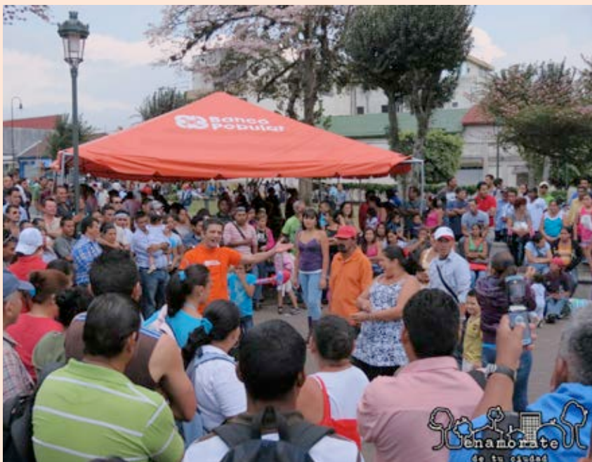
Presentación de Cuentacuentos en el Parque La Merced, como parte de las actividades de Enamorate de tu ciudad. 2013.