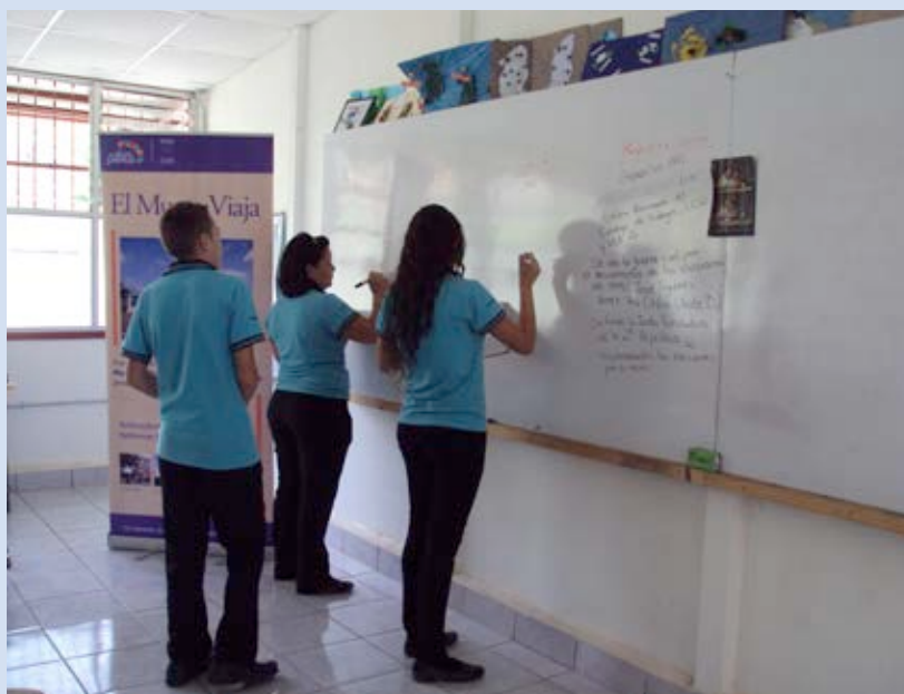
Estudiantes del Liceo Rural de Pacayitas de Turrialba (Cartago), participaron del Programa "El Museo viaja" del Museo Dr. Rafael Ángel Calderón Guardia. Año 2013.

Con el objetivo de transmitir la importancia de la Reforma Social de los años cuarenta en el desarrollo de Costa Rica, se realizaron en total 50 visitas guiadas que incluyeron charlas explicativas, materiales audiovisuales y el acercamiento directo a la colección de las salas históricas del Museo que se extienden a las exposiciones artísticas temporales. Se atendieron estudiantes de secundaria y de universidades, individual o colectiva, grupos organizados y público en general; así como visitas no programadas.