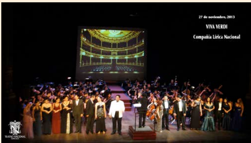
Escena de la ópera "Viva Verdi" de la Compañía Lírica Nacional, uno de los muchos espectáculos presentados en la sala principal del Teatro Nacional. Noviembre de 2013

En el Teatro Vargas Calvo, se realizaron cuatro actividades, que contabilizaron en total 95 funciones con presentación de las obras: "Pentadrama" (2), "La Celda de papel" (28), "Mi papa era comunista" (33) y "Alevosía" (32), contabilizando una asistencia de 3.180 personas.