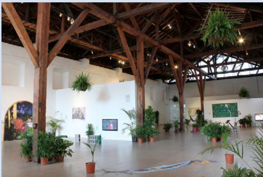
Exhibición "Proyectos ultravioleta" del Museo de Arte y Diseño Contemporáneo. Año 2013.