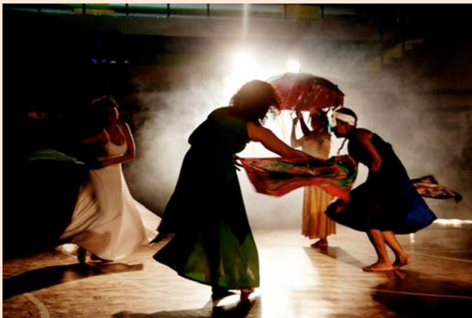
Presentación de uno de los grupos culturales de la Alianza Cultural Limonense en el Festival N-RAÍZ-ARTE. Año 2013.

Costarricense” con cultores de Tortuguero, Cahuita y Limón Centro; el Taller “Turismo Cultural. Puesta en valor del Patrimonio Inmaterial”, organizado por el Centro Cultural de España y Programa ACERCA del Centro Cultural de España.