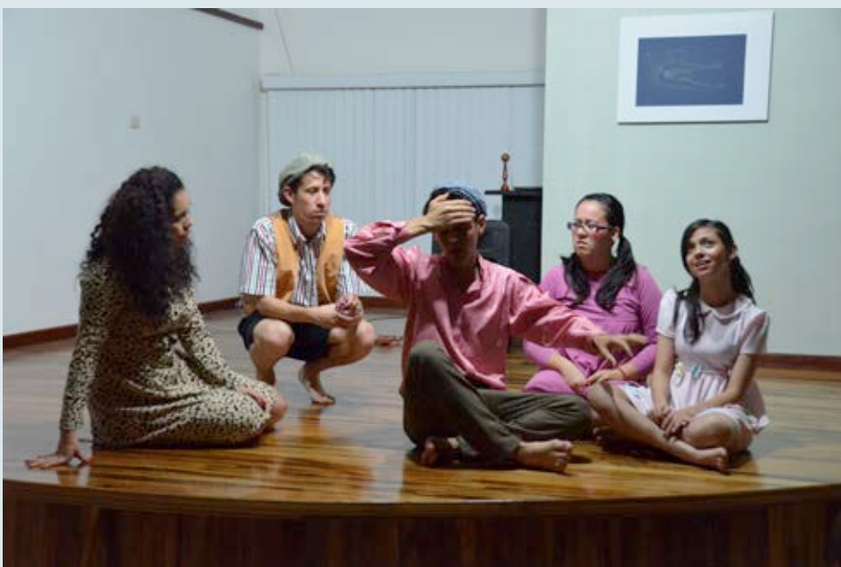
Compañía de Teatro Marquesina de San Ramón, en una de sus presentaciones en el Centro Cultural e Histórico José Figueres Ferrer. Año 2013.

En conmemoración del Día Internacional de la Mujer, en el mes de marzo, se realizaron varias actividades, entre las que destacó la exposición de espejos, confeccionados por las participantes en el concurso Semillas de Arco iris, organizado por el colectivo Mujeres Unidas en Salud y Desarrollo (MUSADE) y el conversatorio “Los principales aportes de las mujeres en la última década en defensa de sus derechos”.