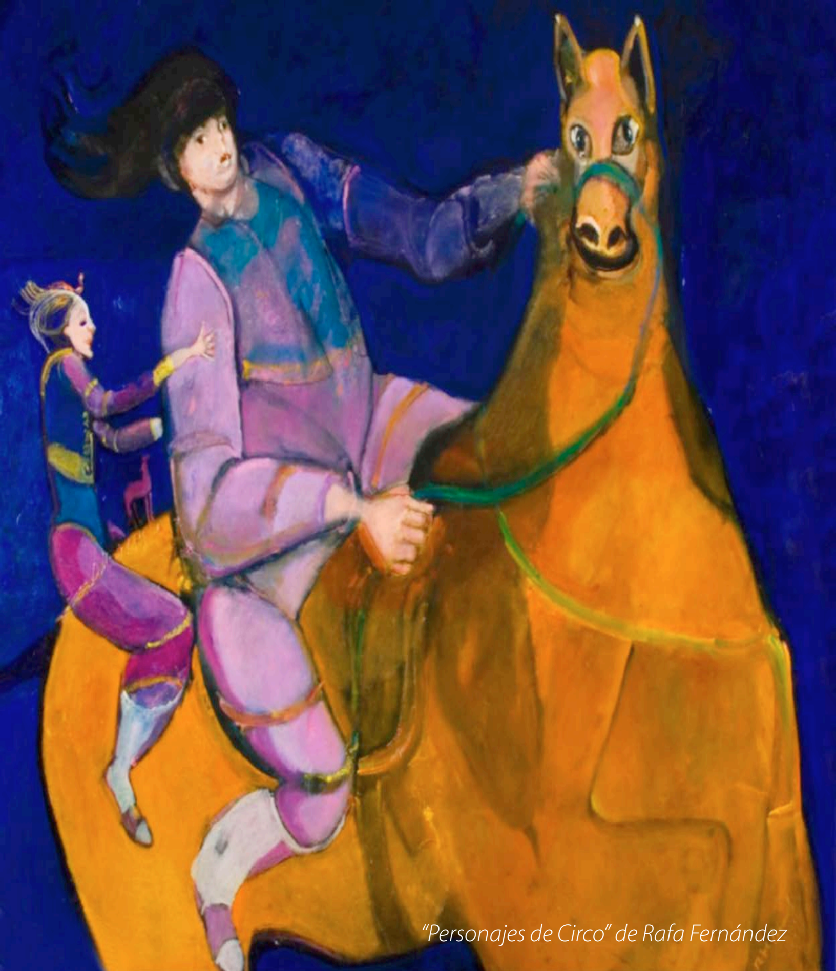
"Personajes de Circo" de Rafa Fernández