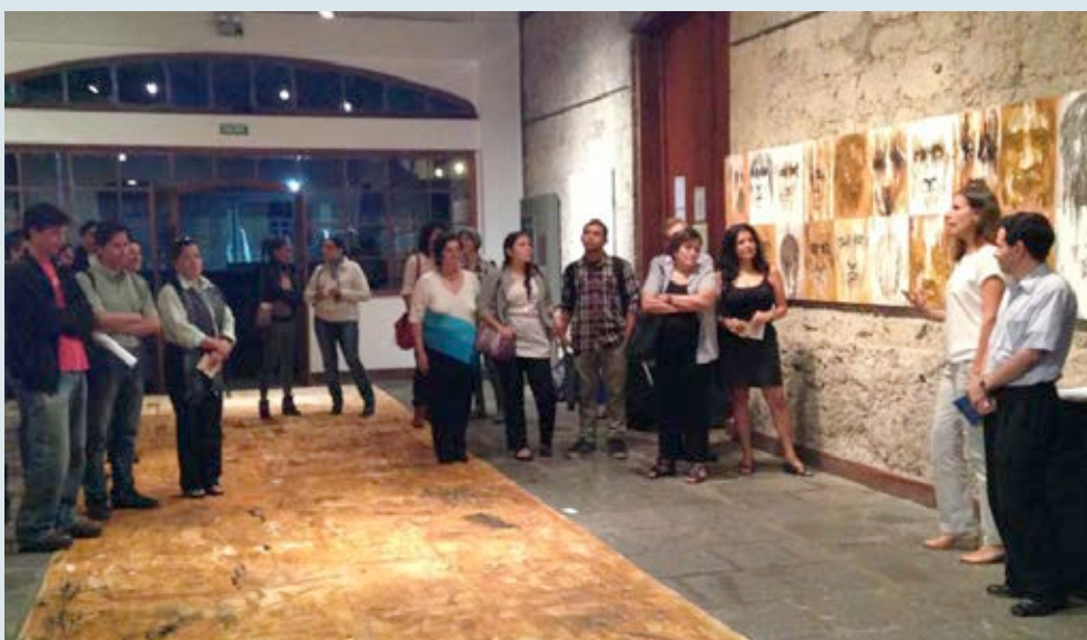
Público asistente a la exposición "Hombres que Miran", en la Galería 1887. Año 2013.

Alajuela (14): Intercambio Cultural, Conociendo nuestras comunidades entre niños y niñas de San Pedro (Poás), Vara Blanca, Altos de San Antonio, Isla Chira (Puntarenas) y Valle de la Estrella (Limón), apoyo Festival Ecológico-Cultural 2013 de Llano Bonito (Naranjo) y al Mes de la Nueva Cultura del Agua 2013 en Laguna (2013), Encuentro de Cultura Viva Comunitaria; Investigación Cultural que recopiló y rescató historias, cuentos y