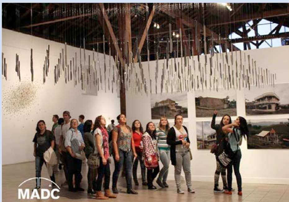
Visitantes en el Museo de Arte y Diseño Contemporáneo, durante uno de los recorridos nocturnos del Art City Tour. Año 2013.

con el apoyo de instituciones culturales y otros colaboradores, el MADC se ha consolidado como una de las sedes principales y punto de salida en estos recorridos nocturnos (a pie, bicicleta y buses eléctricos) por museos, galerías y centros culturales de la ciudad de San José, cuyos acceso y transporte son gratuitos; así como todos los espacios culturales involucrados. En total durante el período, se recibieron 8.742 visitantes en este proyecto.