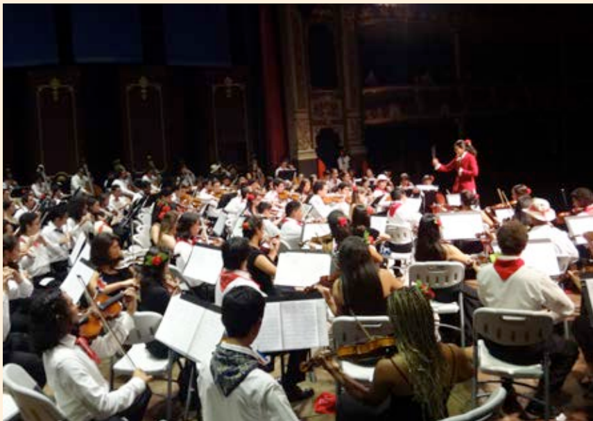
Concierto de la Independencia con la Orquesta Sinfónica Manuel María Gutiérrez del SiNEM. Año 2013.

En el ámbito internacional, importante señalar el envío de una serie de delegaciones a diferentes partes del mundo, entre ellas seis estudiantes y un instructor al “Tennessee Valley Music Festival 2013”, tres estudiantes al “Campamento de Contrabajos de Bradetich 2013” (ambos en Estados Unidos), tres estudiantes al “Encuentro de Verano” de la Orquesta Juvenil del Sodre en Montevideo (Uruguay), una de cuatro estudiantes y un instructor al “Encuentro de Verano” de la Orquesta Sinfónica Infantil de México, una de seis estudiantes a la “Celebración del 45 Aniversario del