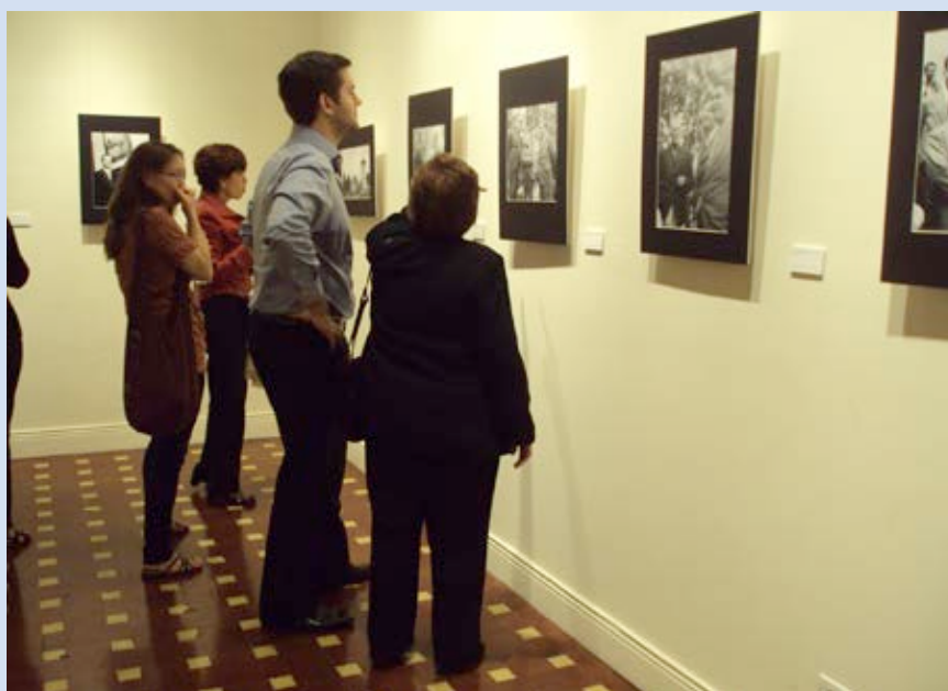
"Ventanas al pasado" una de las exhibiciones ofrecidas al público en el Museo Dr. Rafael Ángel Calderón Guardia. Año 2013.