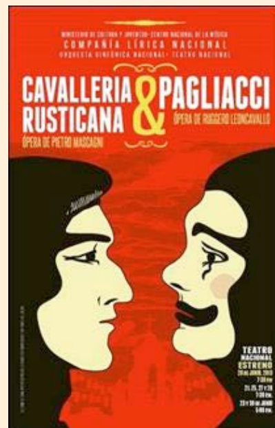
Afiche de las óperas “Cavalleria Rusticana” y “Pagliacci” de la Compañía Lírica Nacional para la temporada realizada en el Teatro Nacional. Junio, 2013.

Asimismo, se aprobó para el Verano Sinfónico realizar una coproducción con la CLN y la OSN, para involucrar a cantantes líricos en los conciertos.