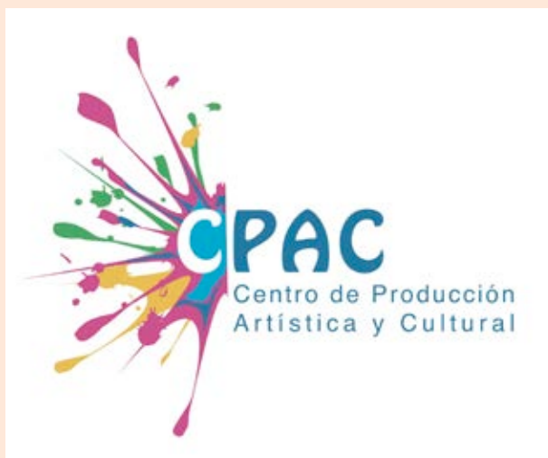
Logo del Centro de Producción Artística y Cultural (CPAC), nuevo programa presupuestario del Ministerio de Cultura y Juventud. 2013

el derecho humano a la cultura, propiciando la participación activa en los procesos sociales, políticos, económicos, fortaleciendo los valores y recreando las identidades y las herencias.