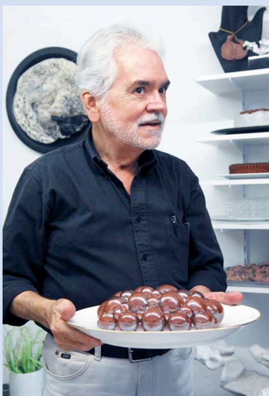
Artista costarricense Carlos Poveda, distinguido con el premio Teodorico Quirós Alvarado. Año 2013.

Con motivo de la presentación del nuevo guión permanente, se dispuso de la Sala de exhibición permanente “Juan Manuel Sánchez Barrantes, espacio dedicado exclusivamente a imágenes de mujeres de la colección con la muestra denominada “Trazos Curvos”.