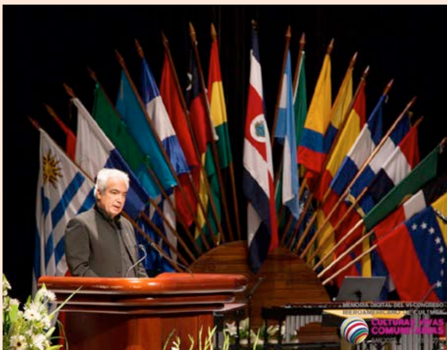
El señor Manuel Obregón, Ministro de Cultura y Juventud, durante el acto de apertura del VI Congreso Iberoamericano de Cultura. 2014

Con el propósito de desarrollar procesos para el fortalecimiento de las políticas culturales, se realizaron giras a diversas comunidades como: En San José: Alajuelita; Alajuela: Sarchí, Atenas y San Ramón; Cartago: El Guarco; Guanacaste: Santa Cruz, Liberia, Nicoya y Cañas; Puntarenas: Rey Curré y Cabo Blanco; y Limón: Pococí. En el caso de San Ramón, se avanzó en la implementación de la política local de cultura, con apoyo de organizaciones culturales comunitarias, el Museo de San Ramón y del Centro Cultural e Histórico José Figueres Ferrer.