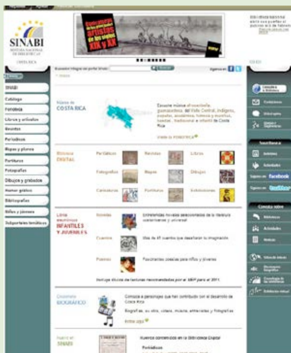
Página principal del portal del SINABI que obtuvo el décimo puesto en la evaluación de sitios web de Costa Rica. Año 2013.

Se realizaron 9.929 actividades educativas y de fomento a la lectura con presencia en casi todo el país, entre las que se encuentran: