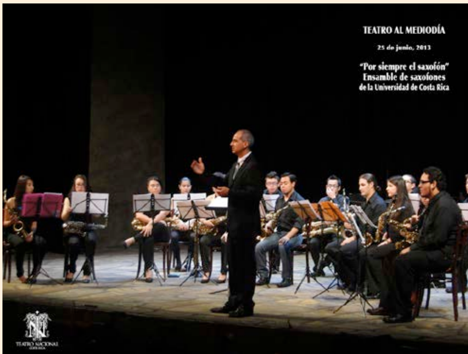
Presentación del Ensemble de saxofones de la Universidad de Costa Rica en el Programa Teatro al Medio Día del Teatro Nacional. Junio de 2013

Otras actividades que destacaron fueron: Presentación de gran cantidad de grupos artísticos como parte de la programación general y eventos de calle, realización de proyectos formativos y educativos con participación activa de la ciudadanía, talleres artísticos didáctico-educativos para niños, jóvenes, adultos y adultos mayores con gran éxito de convocatoria y participación; y encuentros de literatura, artes visuales y artesanía elaborada por artistas nacionales.